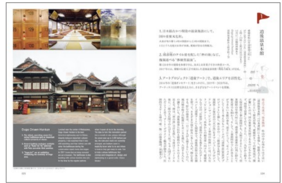
※中面ページ例：dマークレビュー(画像は愛媛号より)